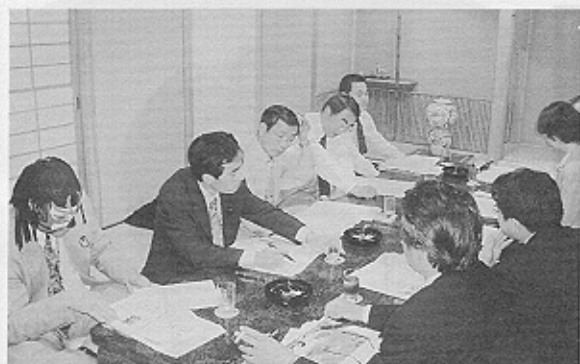
事前勉強会（二戸ロイヤルパレスにて）

一、二戸市 上斗米、県境産業廃棄物不法投棄現場 二、二戸町 奥中山、いわて子供の森