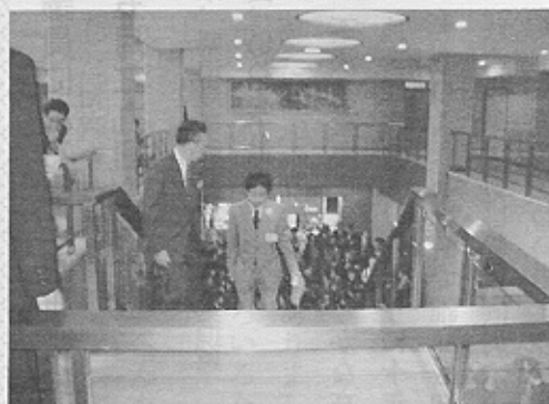
大勢のマスコミにかこまれて初登庁

ございました。私にとりましては、思いもよらぬ投票数を頂き身がひきまるとともに今後4年間の議員生活に大きな責任が生じてきたものと、改めて実感しているところであります。